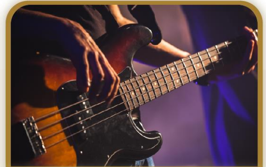
El bajo eléctrico