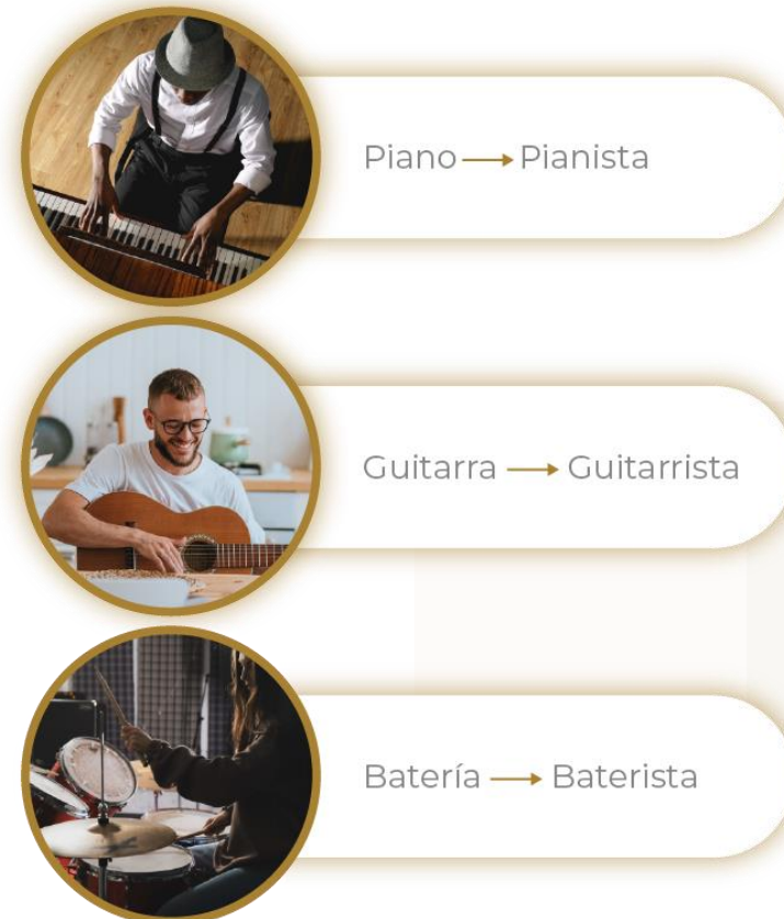
Figura 1. Terminación -ista relacionada a la profesión musical.

Normalmente se agrega la terminación -ista para escribir la profesión relacionada con un instrumento musical: