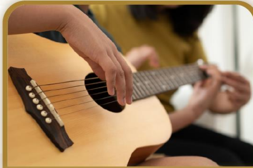
La guitarra (eléctrica)